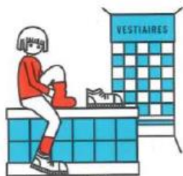
Je me déchausse