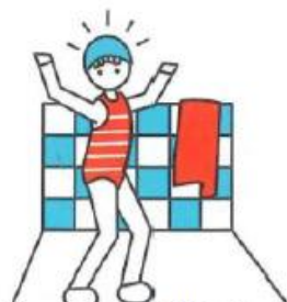
Je mets mon maillot de bain et mon bonnet