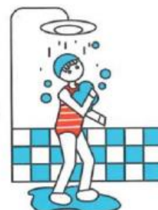
Je prends ma douche