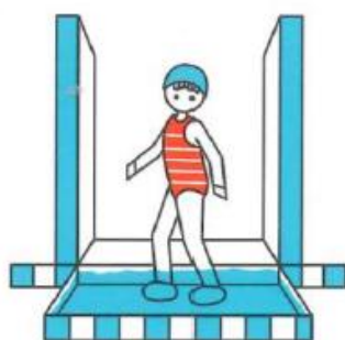
Je passe par le pédiluve, pour rincer mes pieds